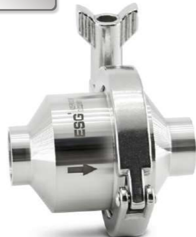
Присоединение Под сварку