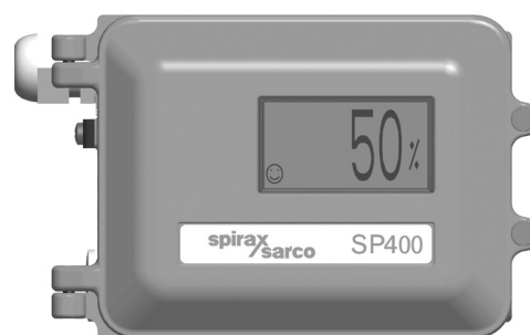
SP400 с закрытой крышкой